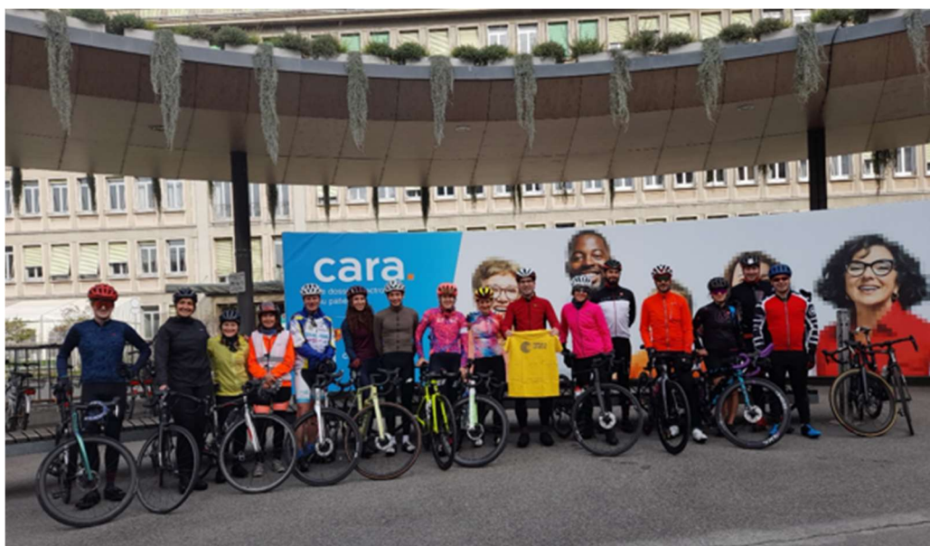
Les anesthésistes cyclistes au départ de leur randonnée, devant les HUG

Le cyclisme a tenu une place de choix cette année. Nous avons bénéficié de fonds récoltés par les anesthésistes romands lors d'une randonnée cycliste qu'ils et elles ont organisé en notre faveur.