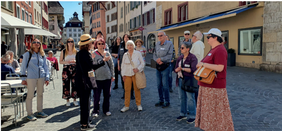
Unterwegs mit FRAGILE Stadtführung Aarau