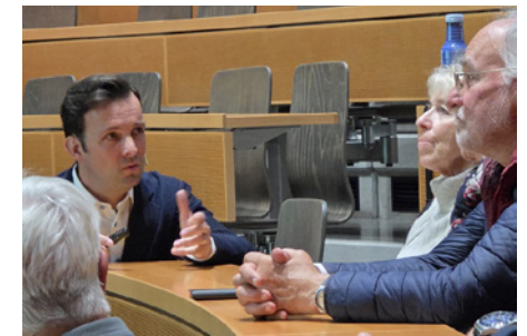
Öffentlicher Vortrag Delir