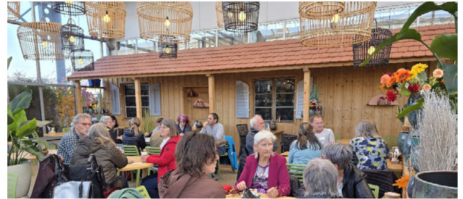
Unterwegs mit FRAGILE Huplant