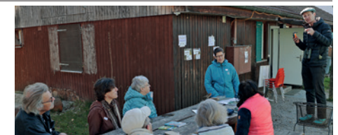
Kurs «Wer zwitschert und fliegt denn da?»

Selbsthilfegruppen, Treffpunkte, Freizeitangebote und Peerberatung 2025: Detaillierte Berichte siehe Folgenseiten.