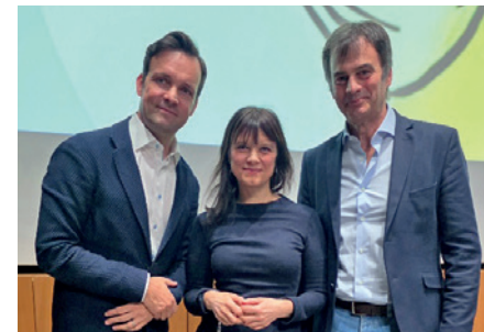
Öffentlicher Vortrag Delir