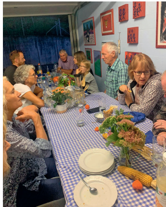
Vernissage, organisiert für die Selbsthilfegruppe St. Gallen und geladene Gäste.