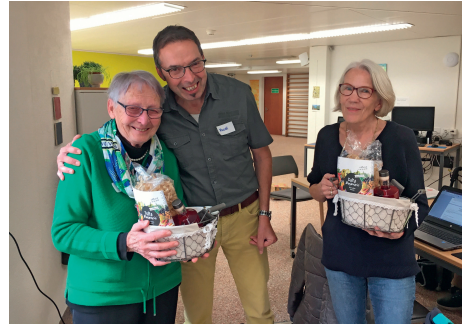
Abschied der Aphasiegruppenleiterinnen. Die Gruppe ist jetzt als eigener Verein unterwegs, bleibt aber mit FRAGILE Ostschweiz verbunden.