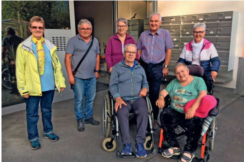
«Maibummel» der Selbsthilfegruppe Buchs.