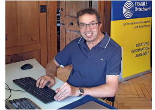
Der Präsident an seinem Arbeitsplatz in der Geschäftsstelle.