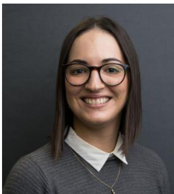
SHG Leiterin Peer

Als selbst betroffene kenne ich die Thematik bestens und kann dich mit meinen Erfahrungen aktiv begleiten.